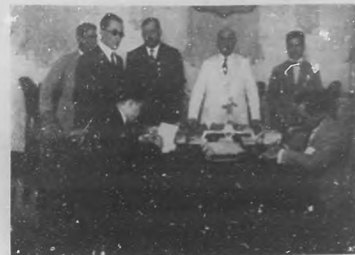
LA NUEVA DIRECTIVA DE LA "ASOCIACION CANARIA" — Los miembros que forman la nueva directiva de la progresista "Asociación Canaria", en los momentos en que tomaban posesión de sus cargos.

Una admirable obra escultórica. Publicamos en estas "Actualidades" una fotografía del boceto del monumento que al Generalísimo Máximo Gómez, será erigido, por iniciativas de nuestro estimado colega "El Heraldó", en