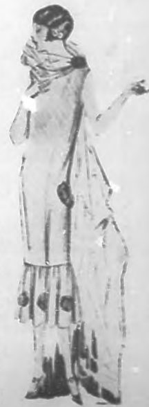
Indio modelo un blanco con bordados en colores.

En esto, como en cualquier otra cosa (Pasa a la Pág. 31.)