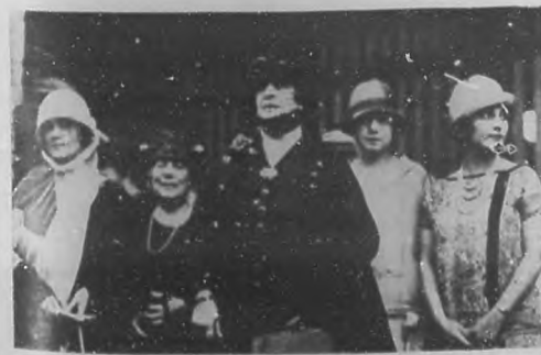
EL VIAJE DE UNA DAMA ILUSTRE. —La Marquessa de Larrinaga, figura prominente de la aristocracia cubana, en los momentos de embarcar para Europa, rodeada de algunas de las personas que fueron a despedirla.

Notable violinista rumano, que se acaba de establecer en la Habana y que ha sido nombrado profesor de violín del Conservatorio "Carnicer".