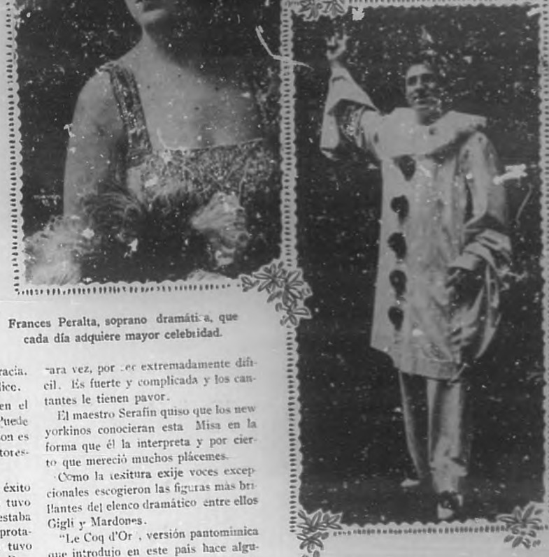
El eminente tenor Martinelli en "Pagliacci".

En contra de lo que dije en una de mis columnas anteriores, Giovanni Martinelli, ha vuelto a cantar durante esta temporada, después de una ausencia de tres meses. Hizo su reaparición en "Los