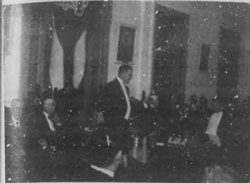
BRILLANTE ACTO. —Momentos en que eran entregados los diplomas a los alumnos de la Escuela Farmacéutica, brillante acto celebrado días pasados en los salones de la Cruz Roja.