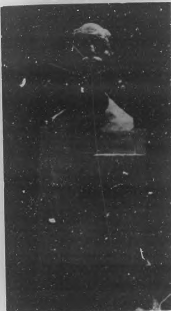
Boceto del monumento al Generalísimo Máximo Gómez, que por iniciativa de "El Heraldó", se está construyendo para ser colocado en Bani, Santo Domingo. Esta magnífica obra la está ejecutando el escultor Jesús Lozano.