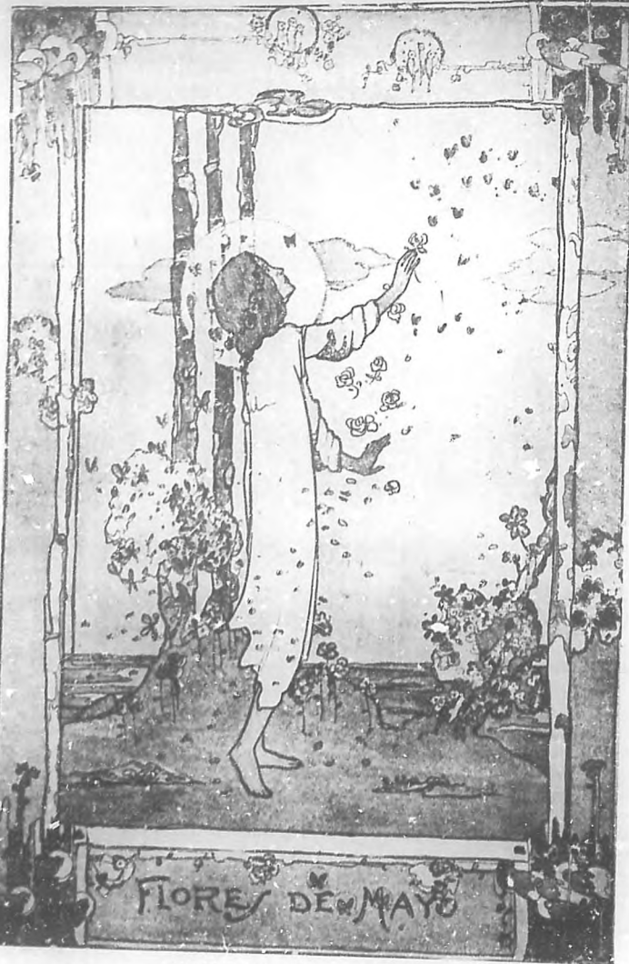
(RECUERDOS DEL CONVENTO)