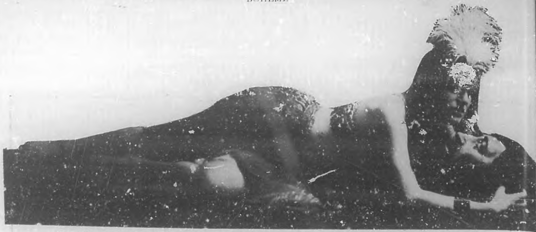
Norka Rouskaya, la notable danzarina, tan admirada en la Habana, en la interpretación de la danza de "Salomé".