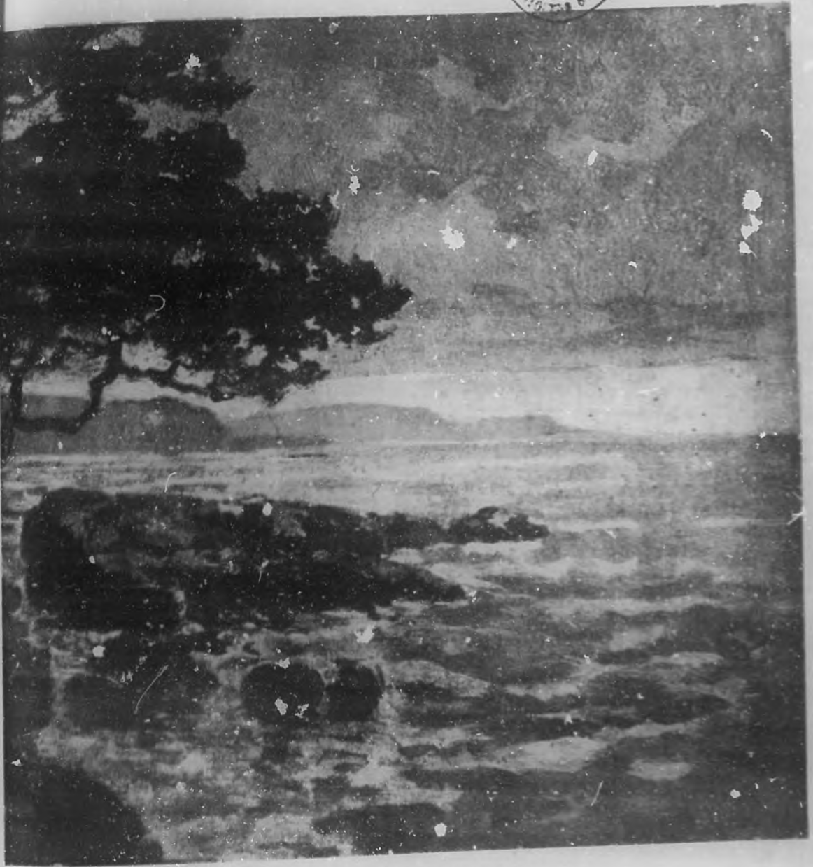
CREPUSCULO EN EL MEDITERRANEO Cuadro de E. Robert.