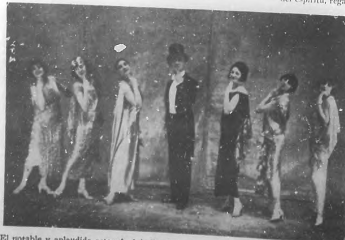
El notable y aplaudido actor Andrés Randall, con un grupo de bellas y graciosas "vedettes" del "Ba-Ta-Clán".

Esto, unido a lo inmejorable de su música y a la corrección de sus empleados, hacen del Gran Cinema uno de los cines más frecuentados.