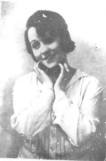
MLLE. FIORELLE Bella y notable artista, estrella del "Ba-Ta-Clán", que es a diario muy ovacionada por su labor admirable.

Nuestra cordial felicitación a cada uno de los profesores de la magnífica orquesta.