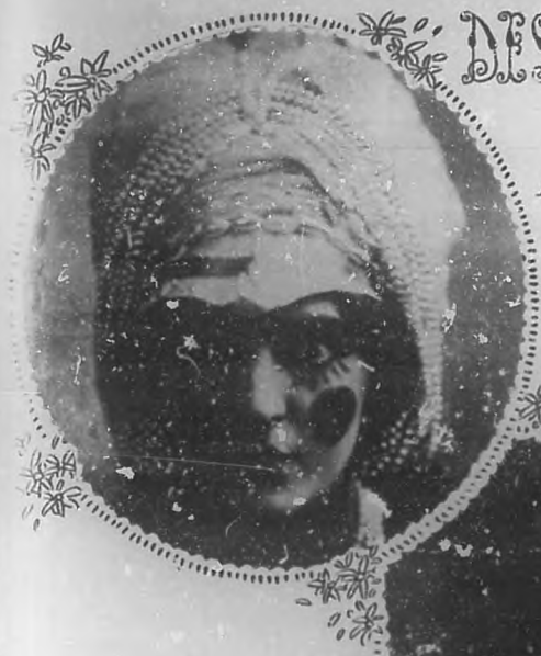
La inimitable Rosina Galli en su papel de Reina Shemakha, en "La Coq d'Or".

La temporada de ópera, toca ya a su fin y yo quiero consignar aquí los acontecimientos de las últimas semanas, en las que hubo una serie de estrenos y muchos artistas laureados.