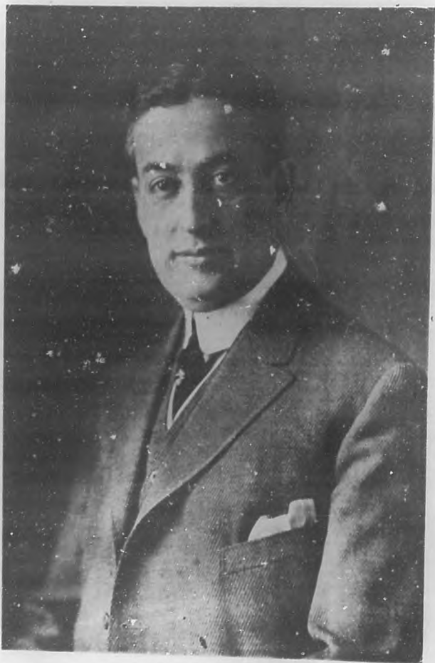
PEDRO MARIN HERRERA Acaudalado gentleman y prestigioso político liberal que ocupará un importante cargo en el gobierno del general Machado.

—Pues sencillamente porque me costó mucho dinero y desilusión. Me convencí de que no había nacido para periodista.